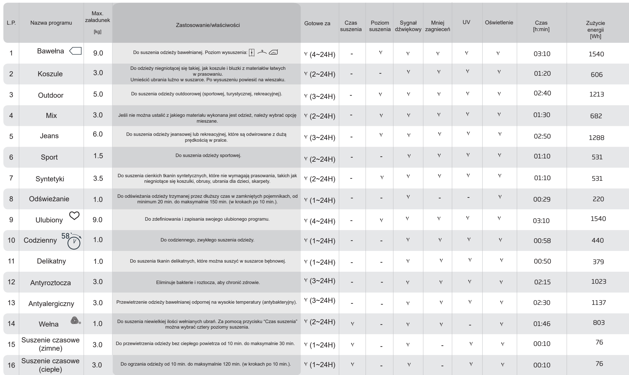
TABELA PROGRAMÓW: AD2C93KISTVAD