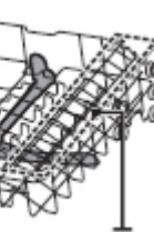
Ablage für Becher